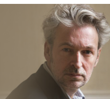
Éric Reinhardt , écrivain