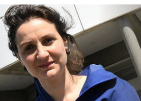
Élise Chatauret , metteuse en scène et autrice