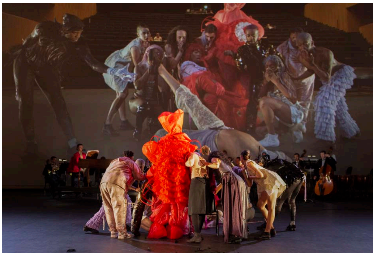
Un Ball Baroque