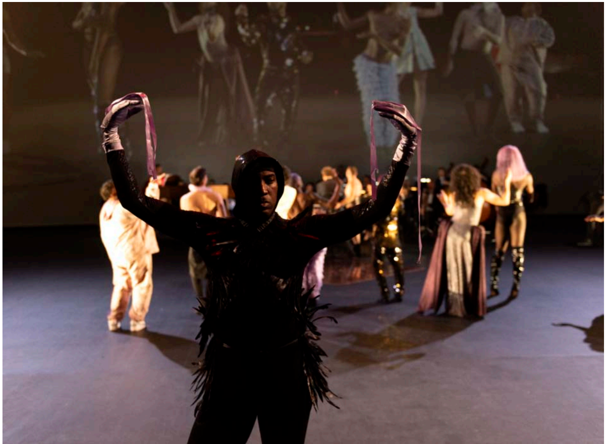
Marquis Revlon © Marc Damage