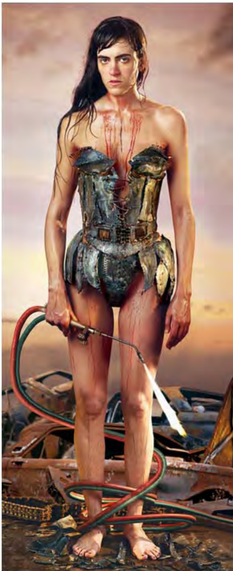
Reina de la chatarra , 2007. 180 x 70cm