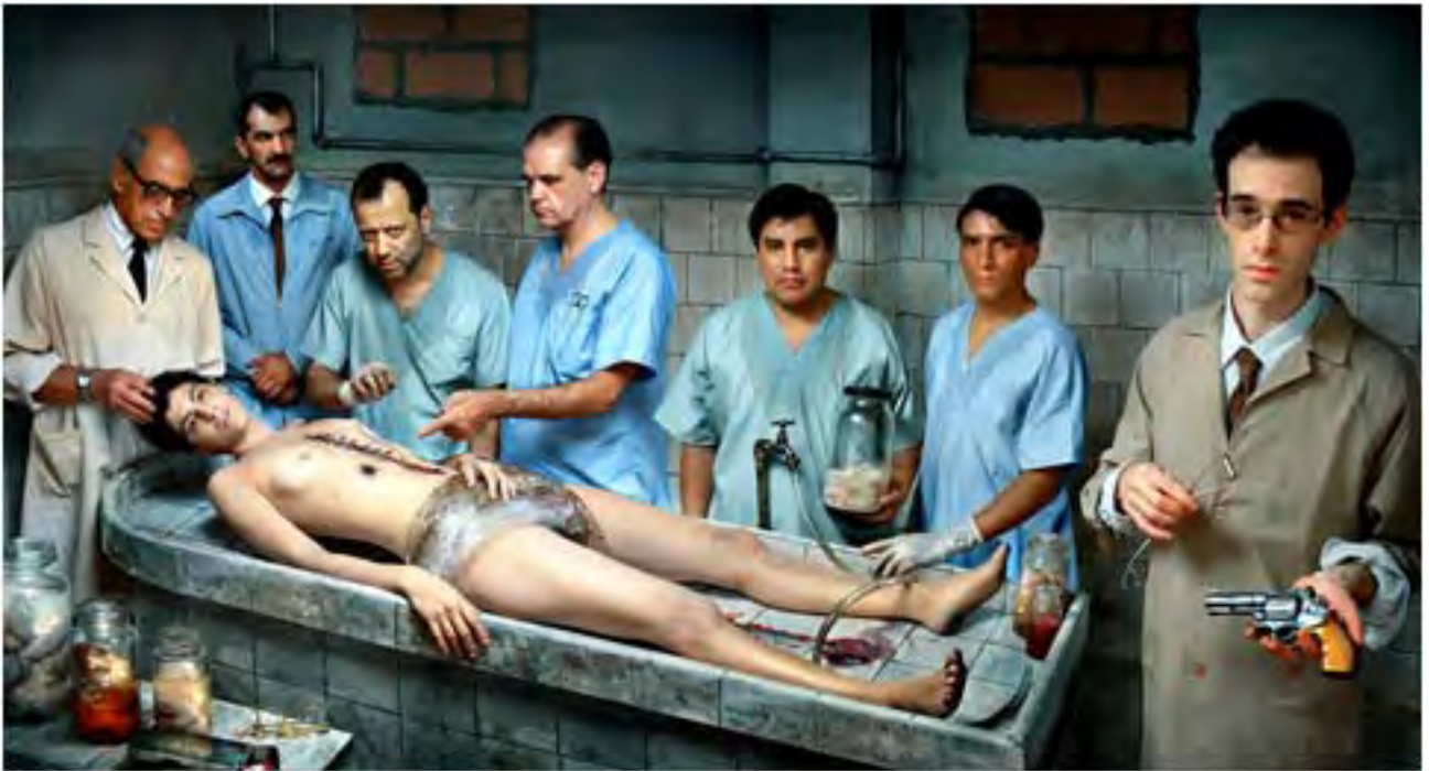
Autopsia , 2005. 120 x 240cm