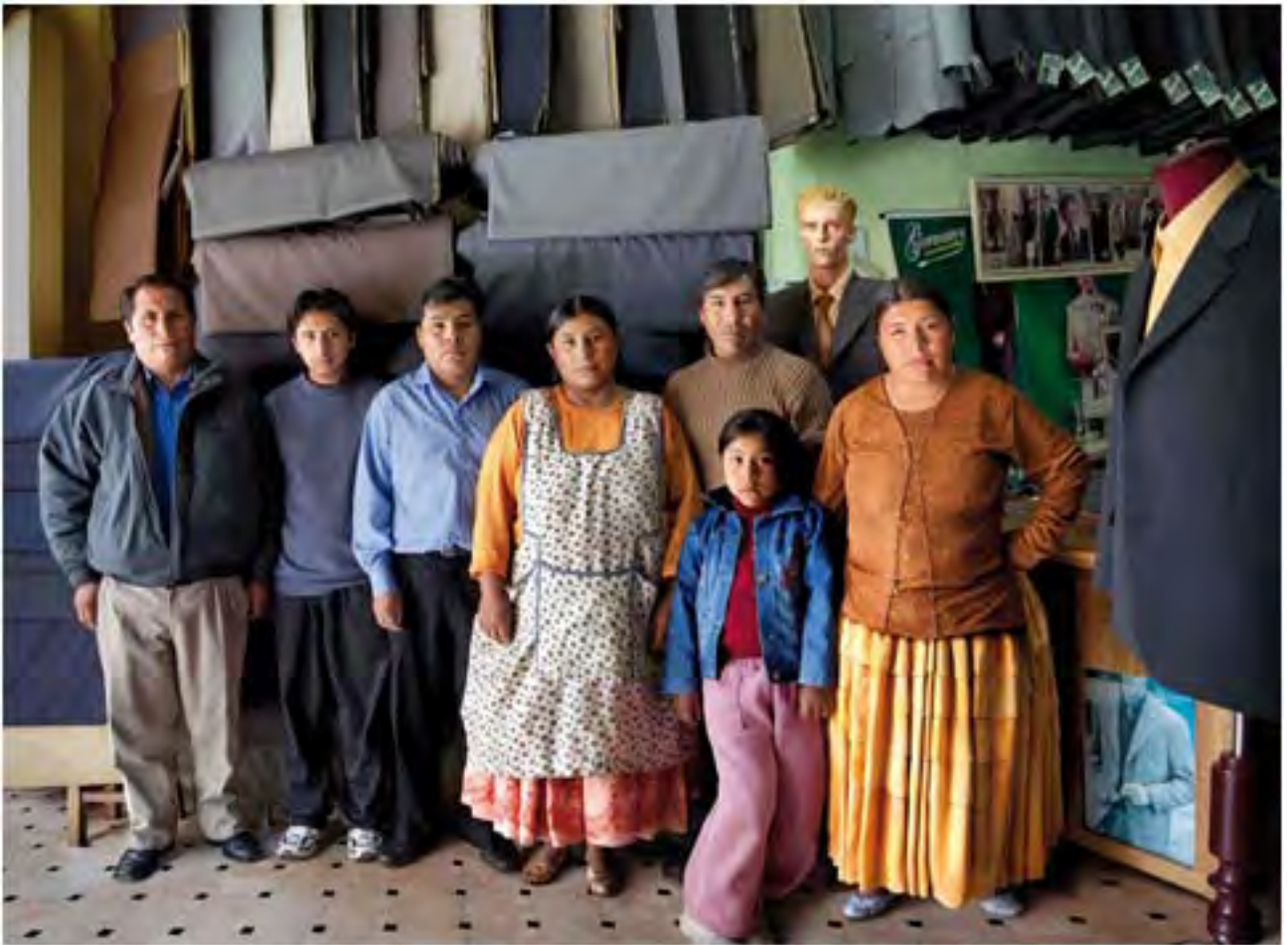
Familia de Sastres, 2010, 118 x 157cm