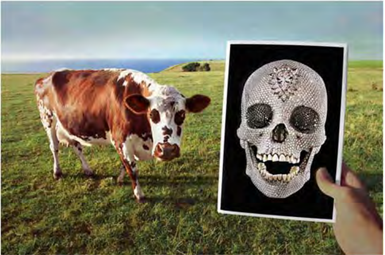
Vaca y Calavera 2010, 70 x 105cm