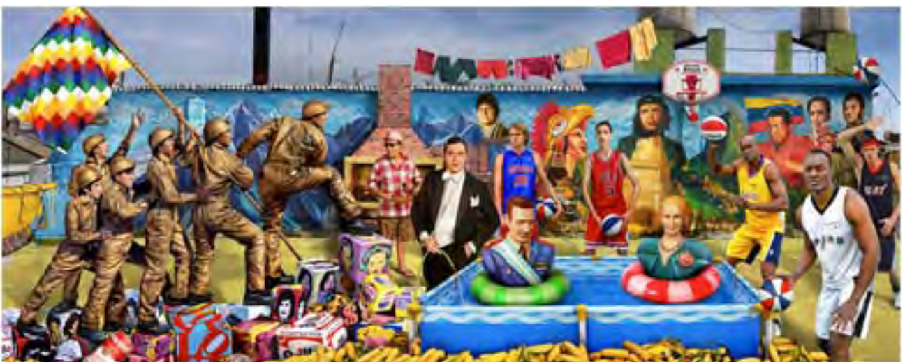
Suite bolivariana, 2009. 100 x 250cm