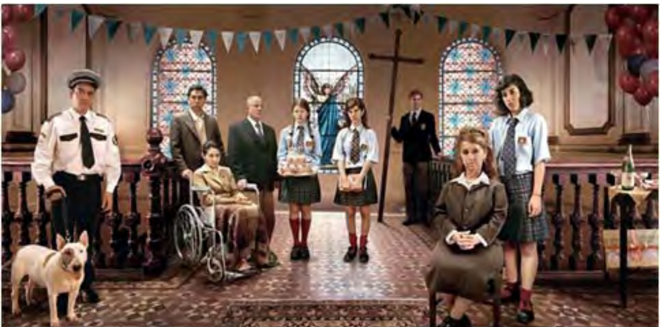
El cumpleaños de la directora , 2008. 120 x 240cm