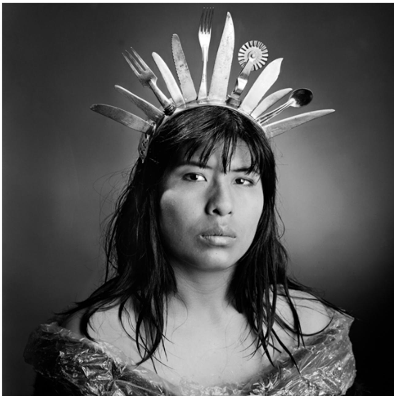
MARCOS LOPEZ « AMANDA », 2005

MAISON DES ARTS / ANNE-MARY SIMON 01 45 13 19 16