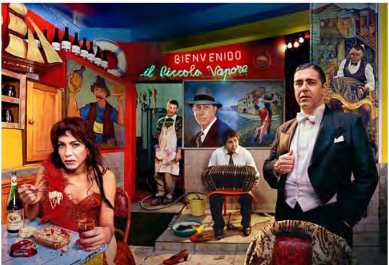
Il Piccolo Vapore, 2007. 123 x 180cm