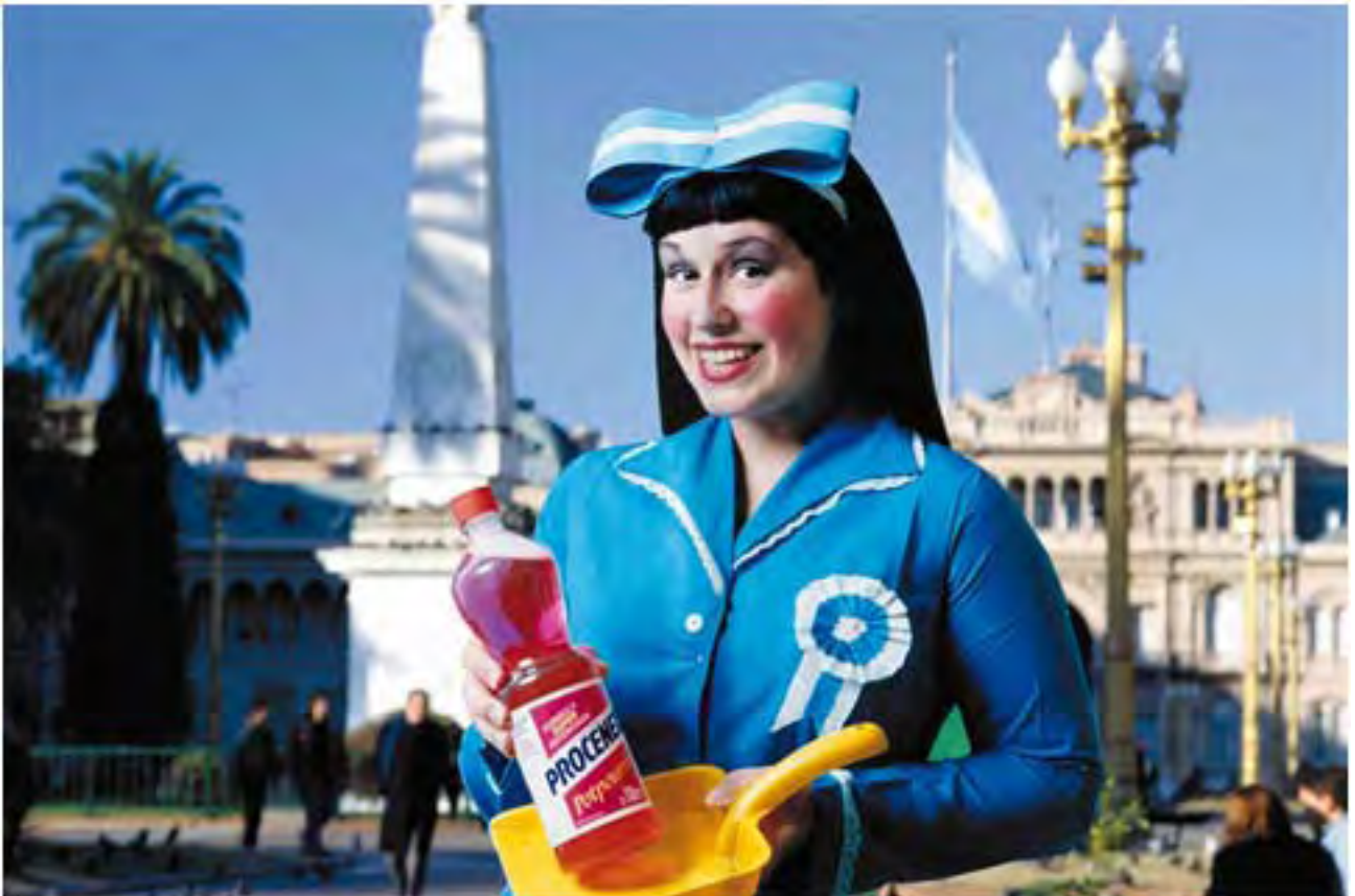
Plaza de Mayo, 1996, 70 x 100cm