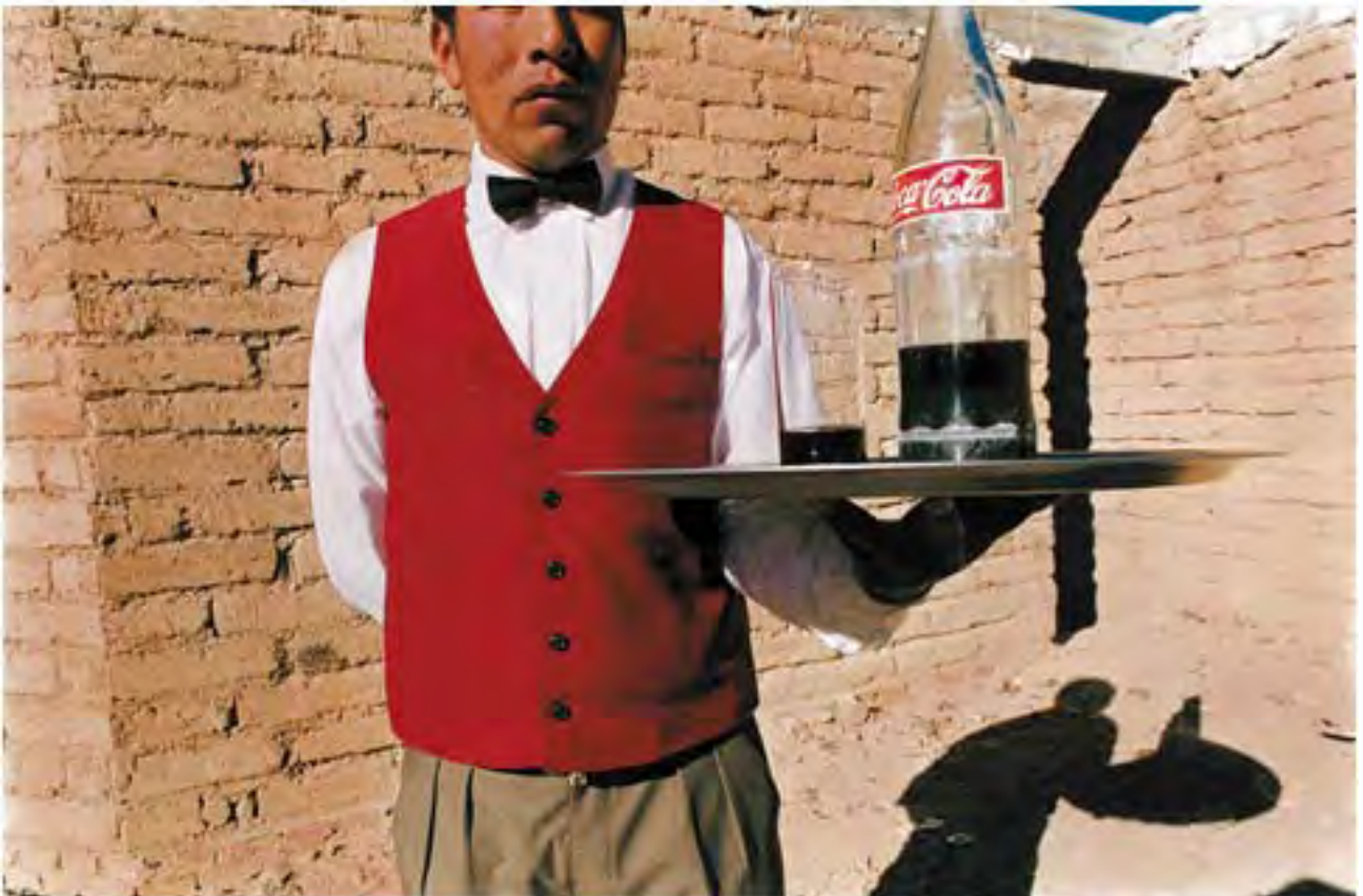
Mozo, 1996, 70 x 100cm