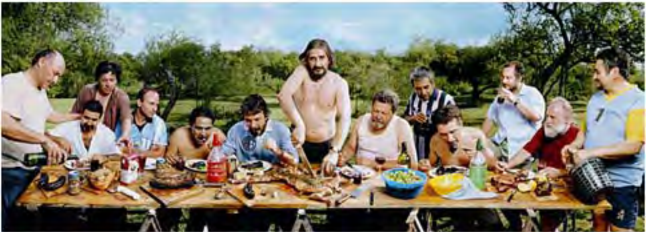
Asado en Mendiolaza, 2001. 100 x 300cm