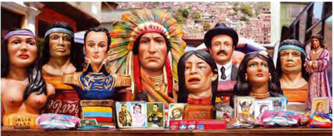
Héroes y santos, 2006. 89 x 220cm