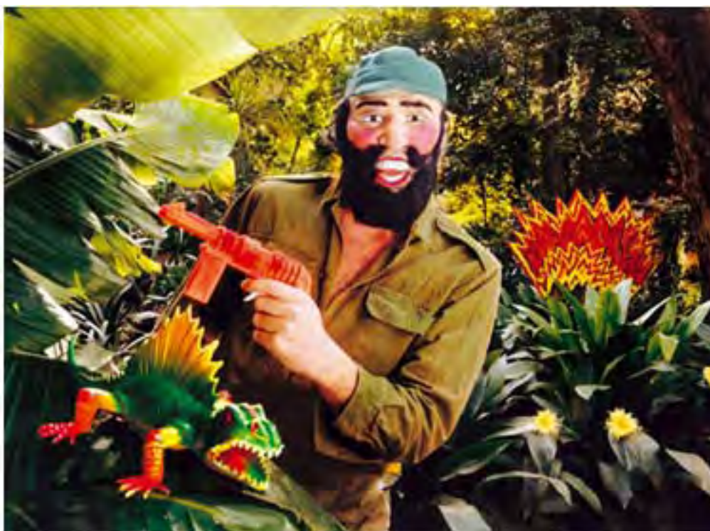
En el jardín botánico , 1993, 100 x 70cm