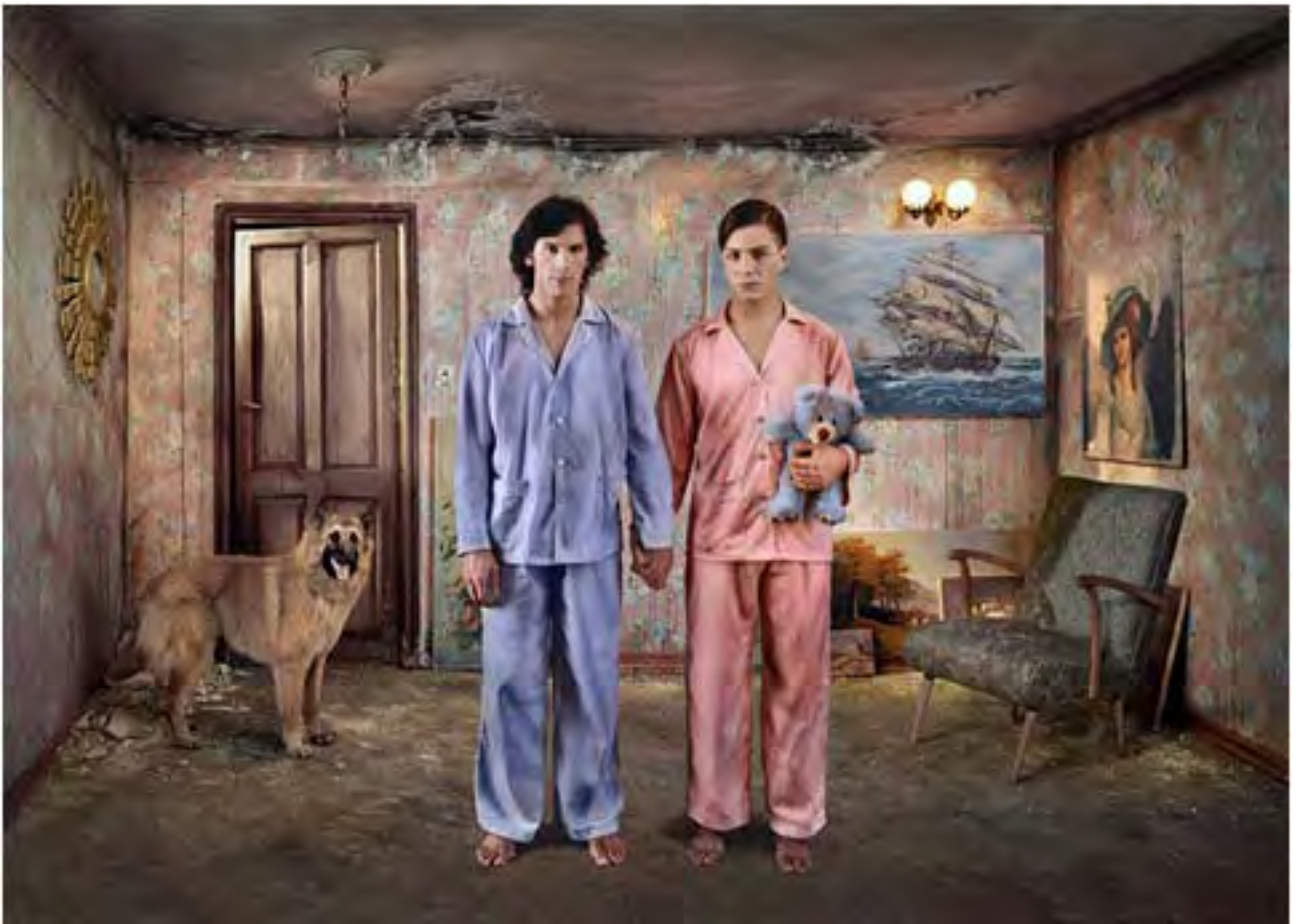
El cuarto rosa, 2007. 100 x 140cm