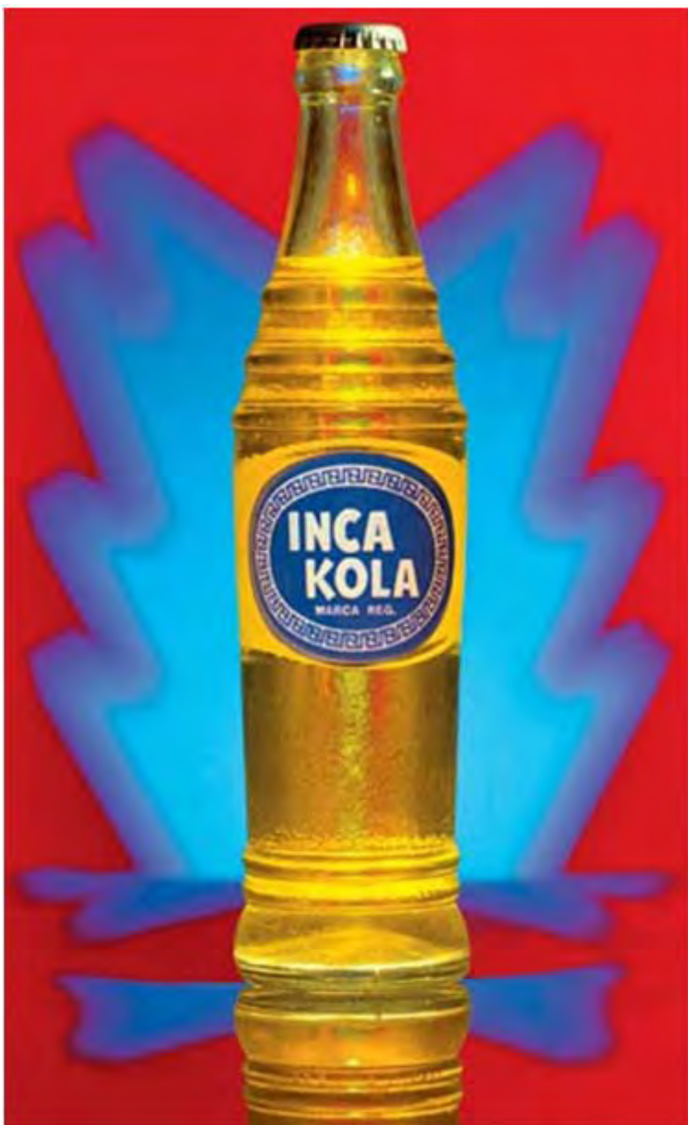
Botella de Inca Cola. 1997, 140 x 100cm