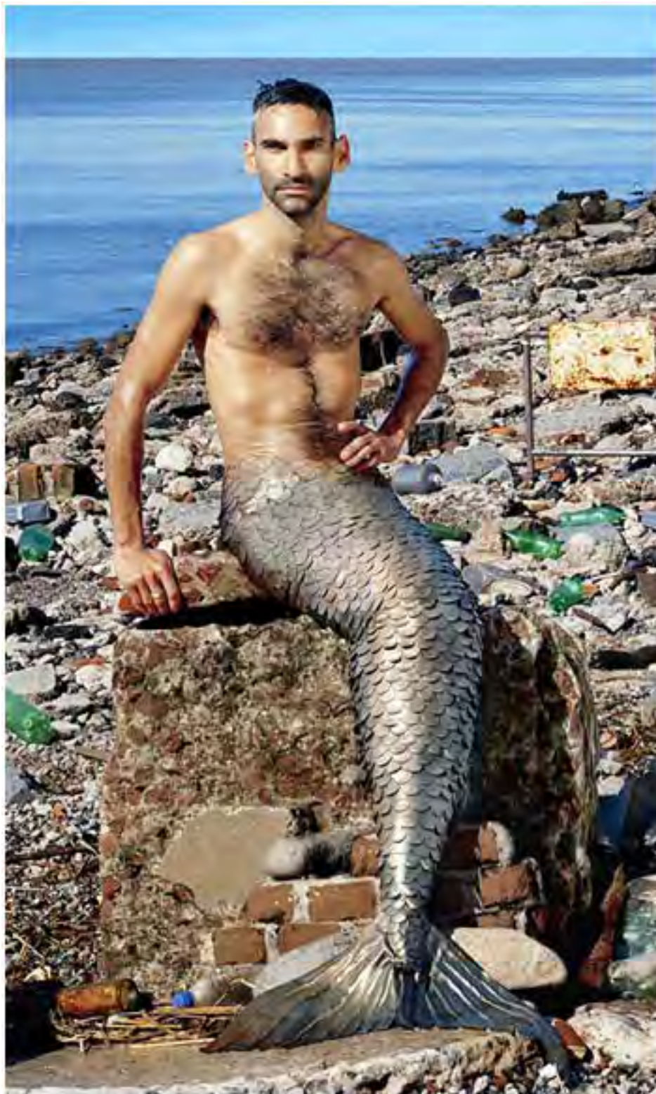
Sireno del Río de La Plata, 2002. 170 x 100cm