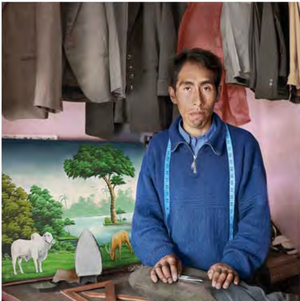
El Sastre, 2010, 50 x 50cm