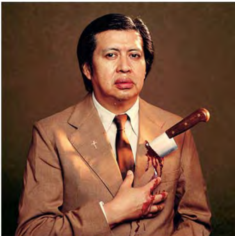
Mártir , 2002. 110 x 110cm