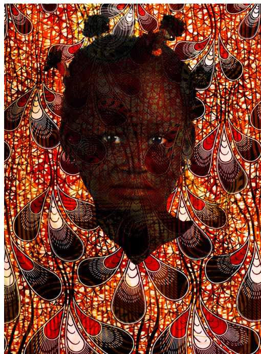
ABSA © Floriane de Lassée