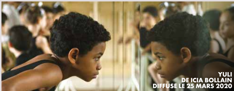
YULI DE ICIA BOLLAIN DIFFUSE LE 25 MARS 2020

A L'OCCASION DU "FESTIVAL INTERNATIONAL DE FILMS DE FEMMES" RETROUVEZ UNE PROGRAMMATION "AU FEMININ" EN MARS ET AVRIL SUR CINE+ CLUB