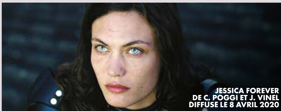
JESSICA FOREVER DE C. POGGI ET J. VINEL DIFFUSE LE 8 AVRIL 2020