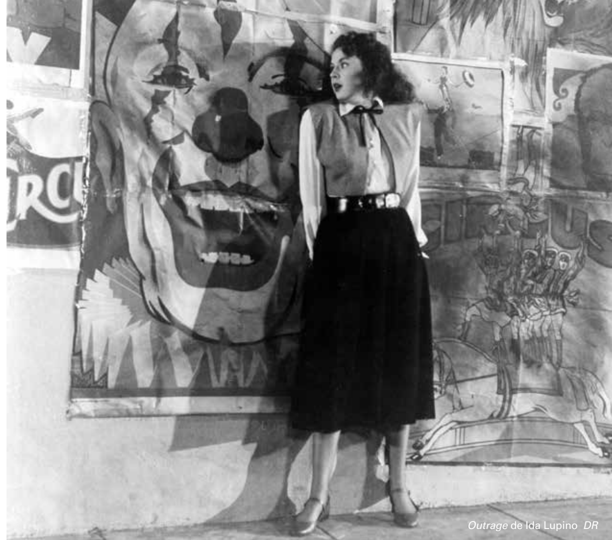
Outrage de Ida Lupino