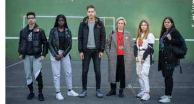
Jury Graine de Cinéphage 2019

Initié en 1985, le jury Graine de Cinéphage se compose d'élèves des lycées Léon Blum (Créteil) et Guillaume Budé (Limeil-Brévannes) qui remettent le prix Graine de Cinéphage parmi 4 films de la sélection :