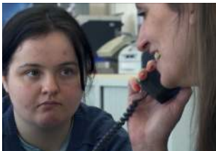
Les Règles du jeu