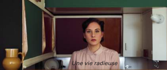
Une vie radieuse