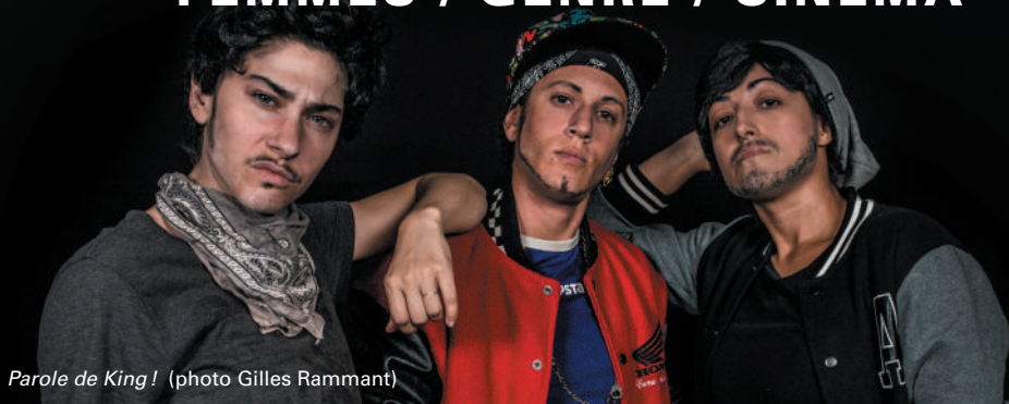
Parole de King!