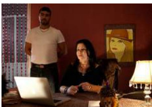
Le Challat de Tunis