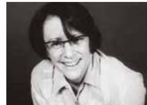
Chroniques d'un Festival