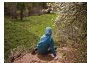
House in the Fields