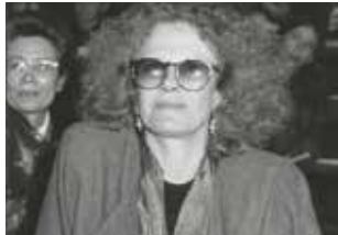
Sois belle et tais-toi