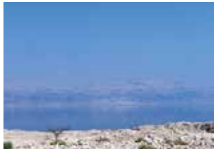
Un long été brûlant en Palestine