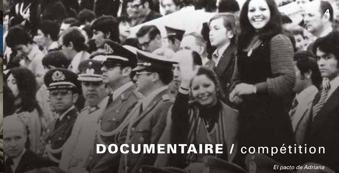
El pacto de Adriana