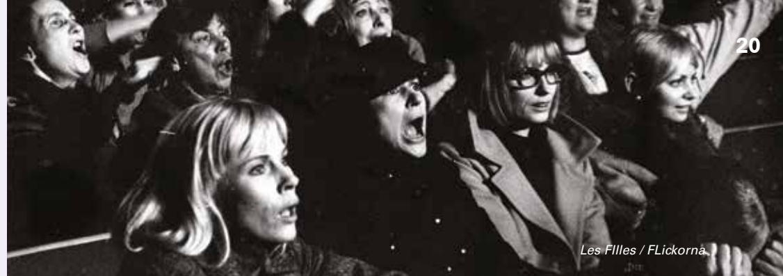
Les Filles / FLICKORNA