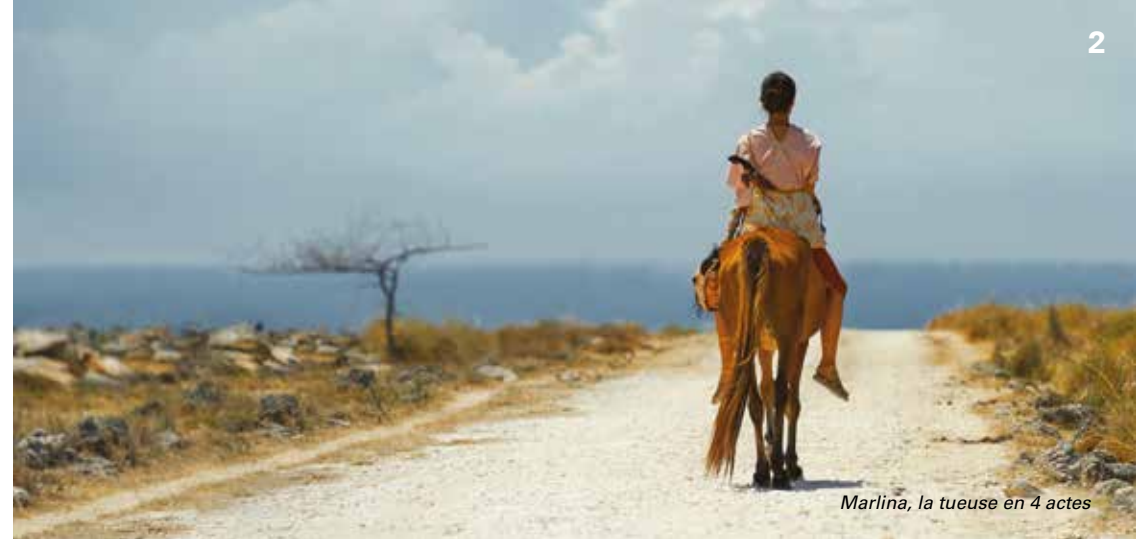
Marlina, la tueuse en 4 actes