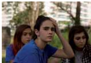
Mate-me por favor