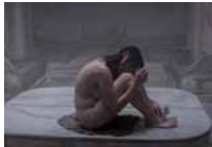
À mon âge je me cache encore pour fumer

Présentation du numéro « Féminismes dans les pays arabes » : les luttes des femmes arabes contre le patriarcat, les pouvoirs tyranniques, l'islamisme, le colonialisme et le néo-colonialisme.