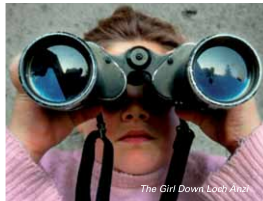
The Girl Down Loch Anzi