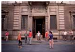
Le Ultimo Cose