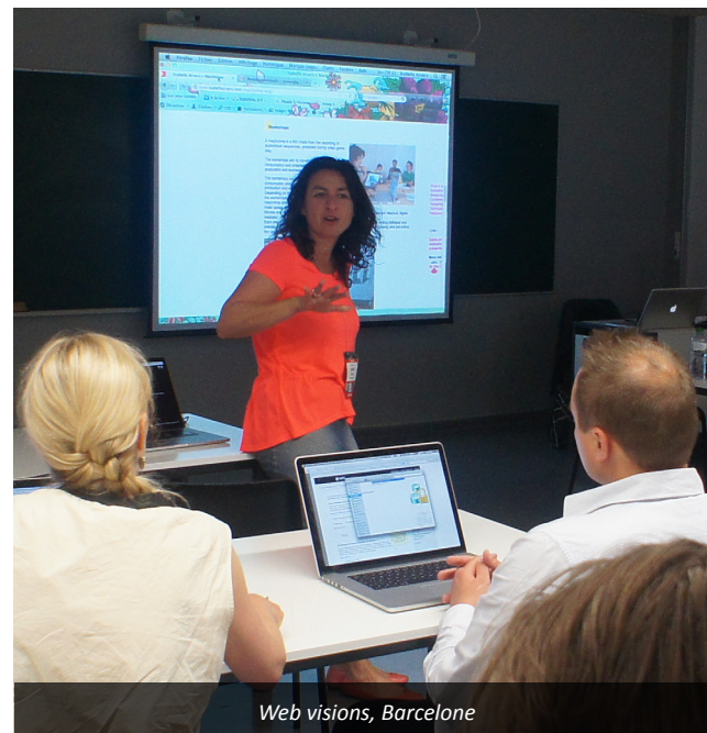
Web visions, Barcelone