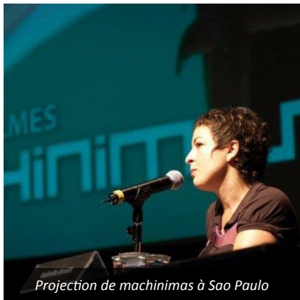
Projection de machinimas à Sao Paulo