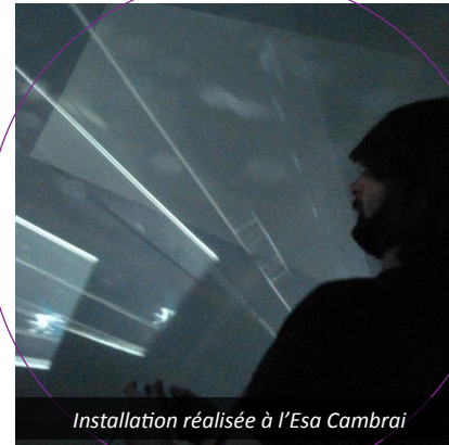
Installation réalisée à l'Esa Cambrai

Les ateliers machinima visent à détourner un objet de consommation de masse et de divertissement en un outil de production de films et en un moyen d'expression. L'atelier machinima / game art vise à créer des œuvres hybrides (installations interactives, machinima interactifs, jeux dans la ville, jeux audio,...)