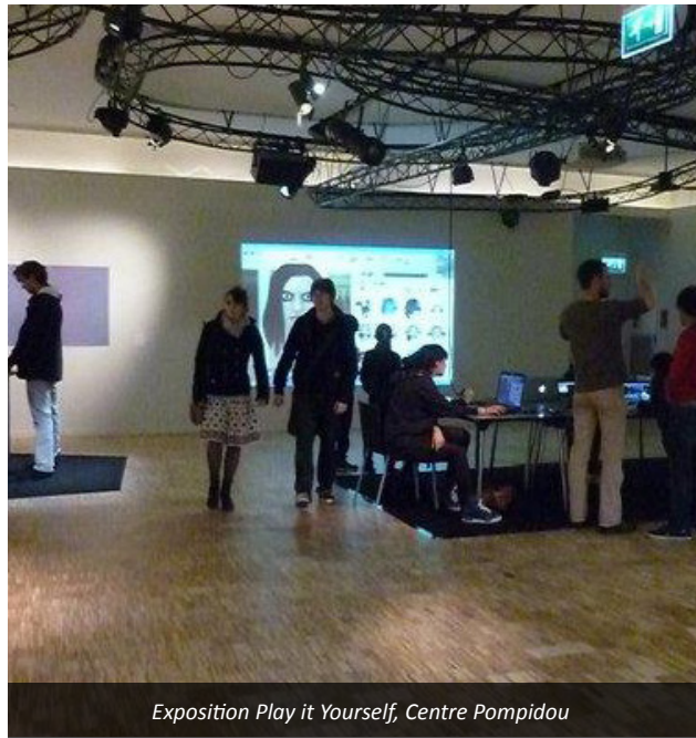
Exposition Play it Yourself, Centre Pompidou

La durée idéale pour la conception d'un ou plusieurs films est de 24 heures mais il est possible de réaliser des films très courts dans des ateliers de 8 à 16 heures (durée minimum d'un atelier : entre 2 et 3 heures)