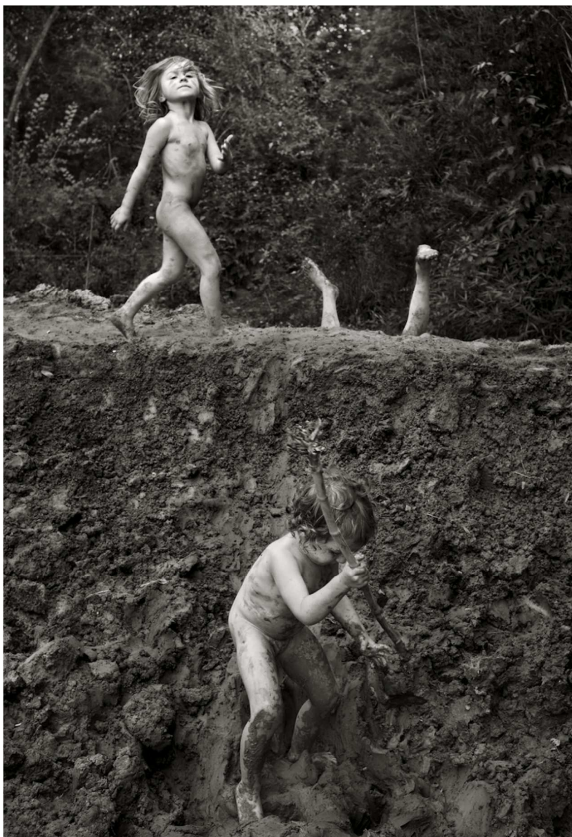
Terre #1