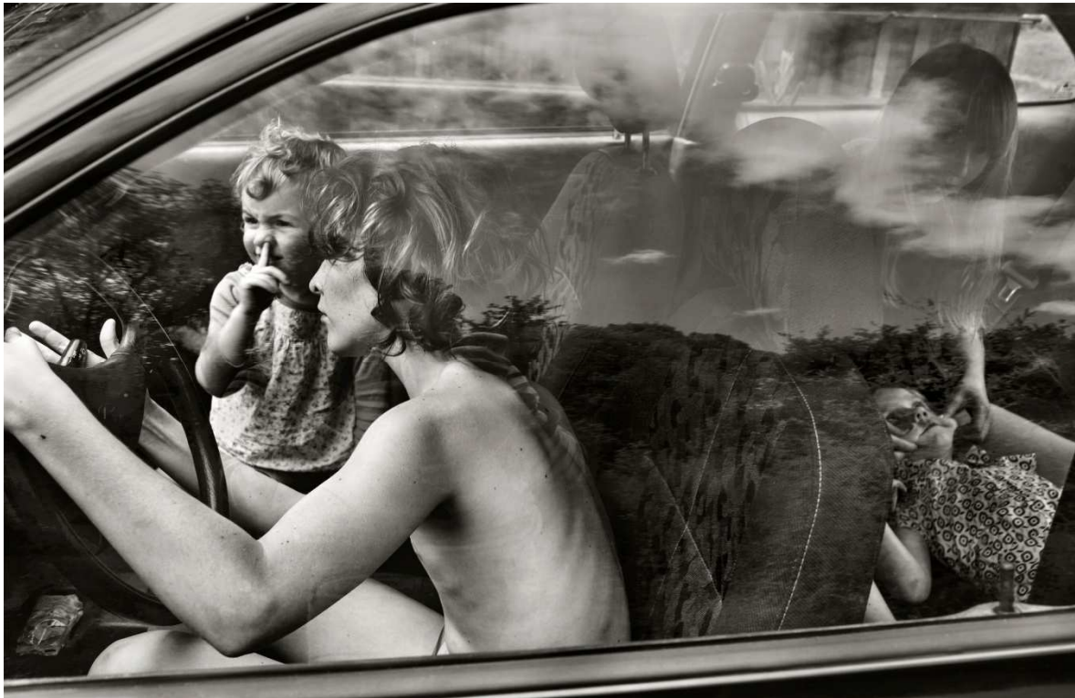
Réservoir Chickens

Une vie au bord du monde où se mêlent l'intemporalité et l'universalité de l'enfance