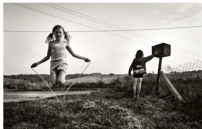
En attendant le facteur